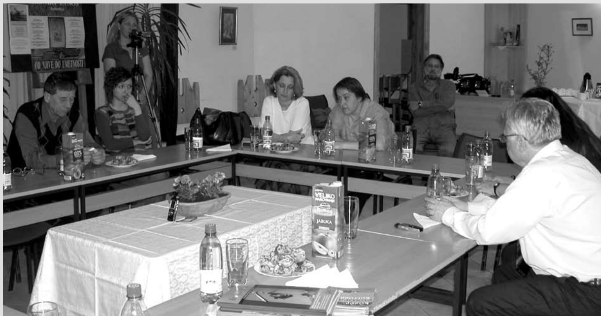
A Vajdasági Magyar Művelődés Intézetben