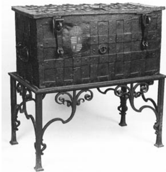
Vasláda a XVII. századból

hivatalos használatának elrendelésével, úgy a nemzeti önállóság szimbólumának, a Szent koronának Bécsbe szállításával nyíltan föltárta a végső célt, amely szemei előtt lebegett ” – olvashatjuk Fraknói Vilmos: Gróf Széchenyi Ferenc című életrajzában.