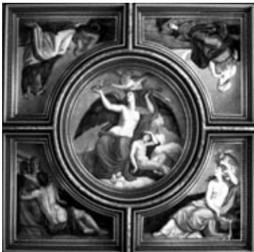
Lotz Károly mennyezeti freskója

Hirdeti majd hálás Hona hűn szerető fia tettét És gondolva nagy áldozatára, Melylyel emelte javát meg a fényét messzi jövőben Cserkoszorút fon ő neki egykor, S míg magyar áll és míg magyar él csak emitt eme földön, Széchényi nagy neve élni fog addig. ■