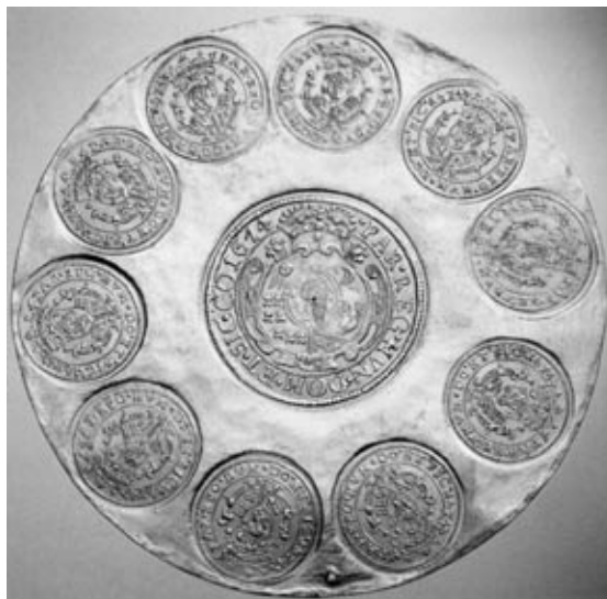
Apafi Mihály százszoros aranyforintja, 1674