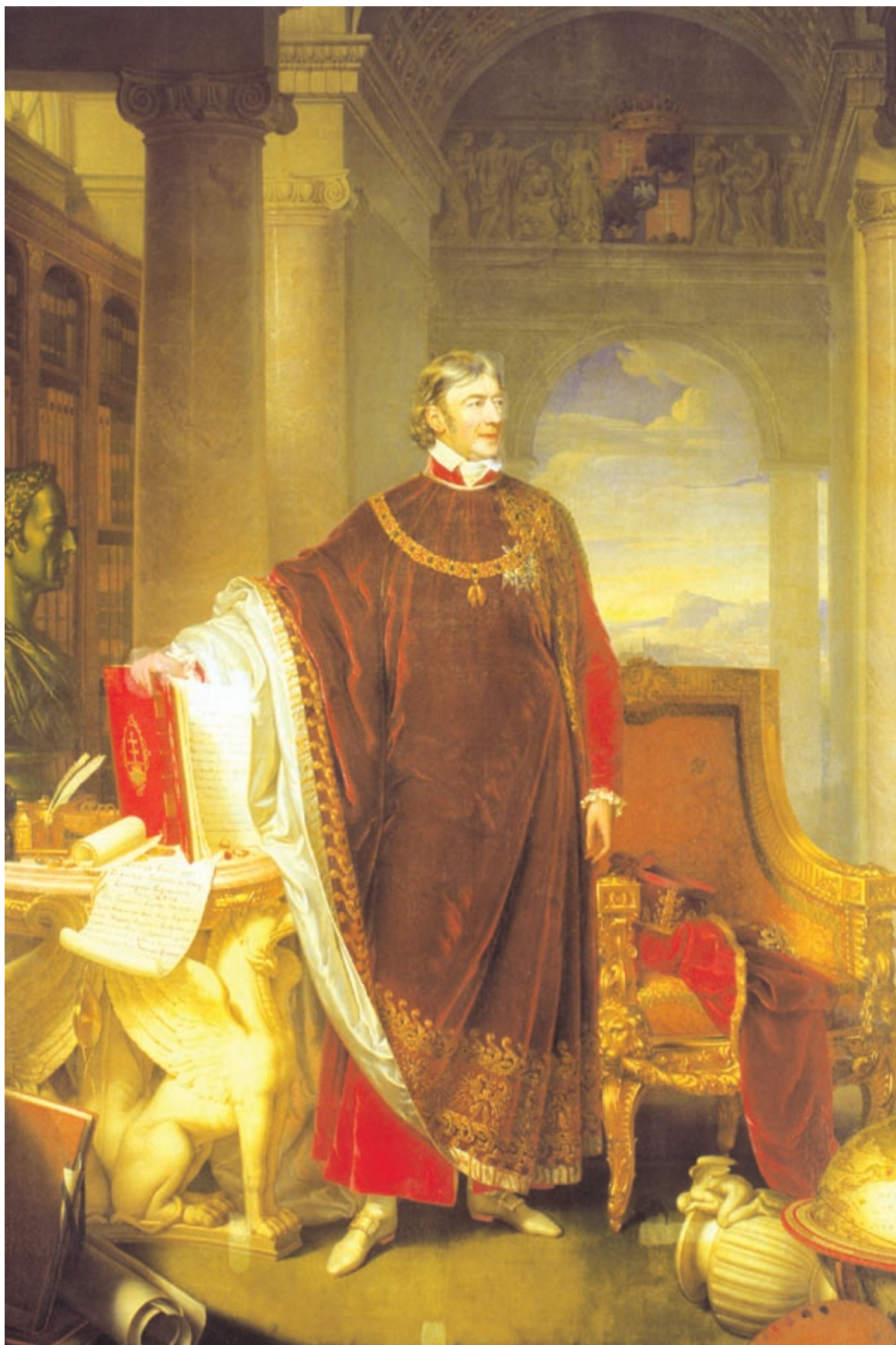
Johann Ender Széchenyi Ferencet ábrázoló festménye, 1823