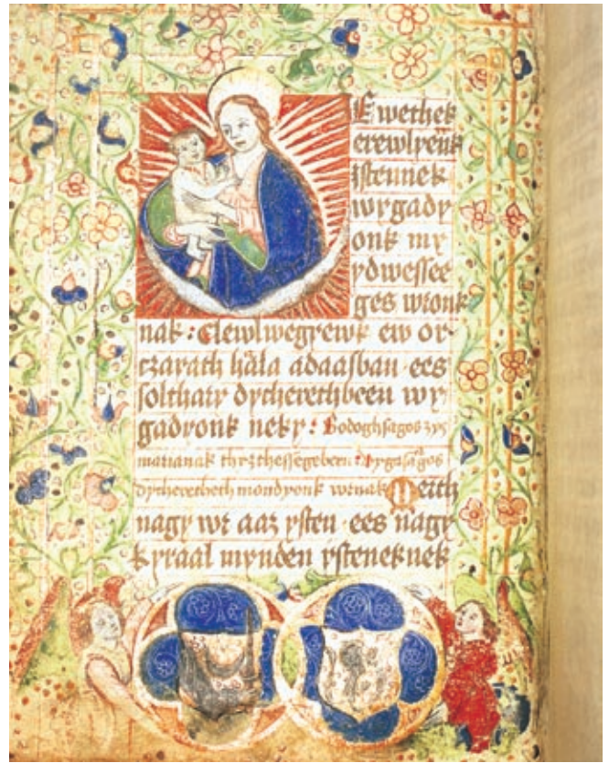
Festetics-kódex, 1494 előtt