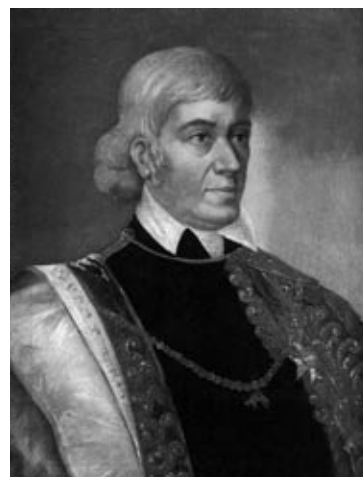
Gróf Széchényi Ferenc

„Azonban hazafiúi lelkét fájdalommal töltötte el az a tapasztalás, hogy József császár reformjainak éle nemcsak azon intézmények ellen irányul, melyek a haladás akadályai valának, hanem a nemzeti lét alapját, a nyelvet támadja meg és miként a német nyelv