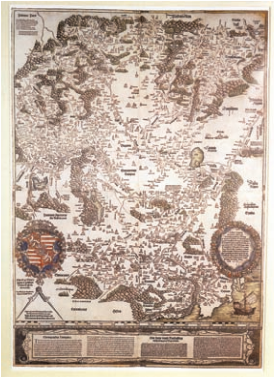
Tabula Hungariae ad quatuor latera... Lázár deák térképe Magyarországról, 1528