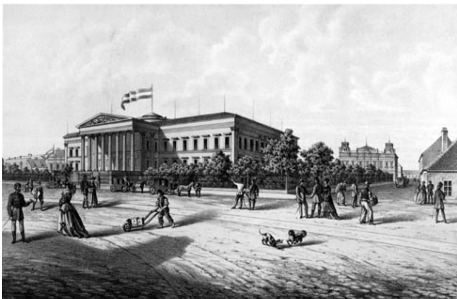
Slowikowski Ádám: A Magyar Nemzeti Múzeum épülete, litográfia, 1865

iratához híven – értékes ásvány-, valamint pénz- és éremgyűjteménnyel gazdagított. Más adományok is érkeztek, így az alapítás után tíz évvel József nádor múzeum rangjára emeli az intézményt, és új, megfelelő épület terveztetéséről intézkedik.