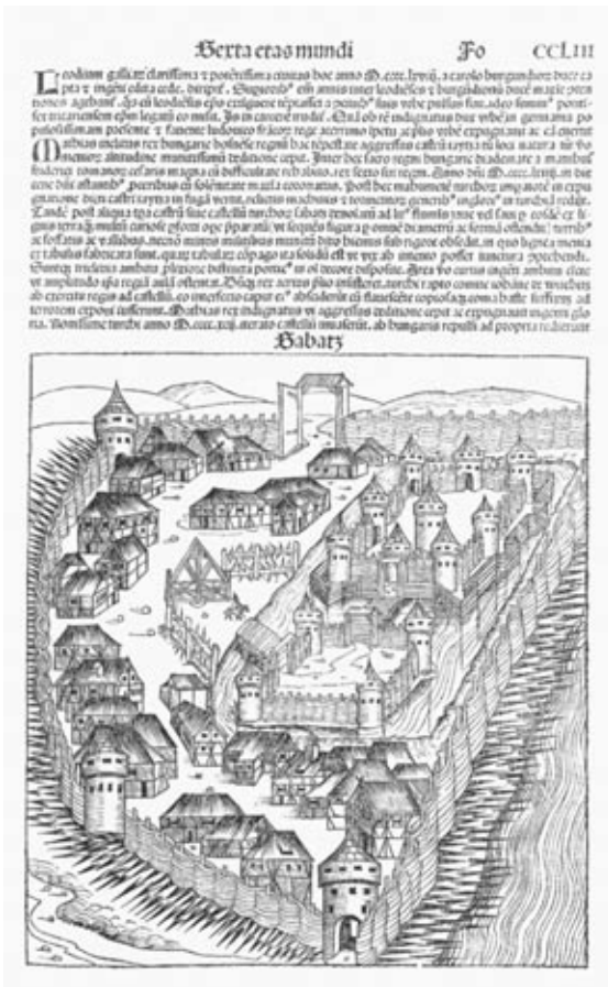
Hartmann Schedel: Liber chronicarum, 1493