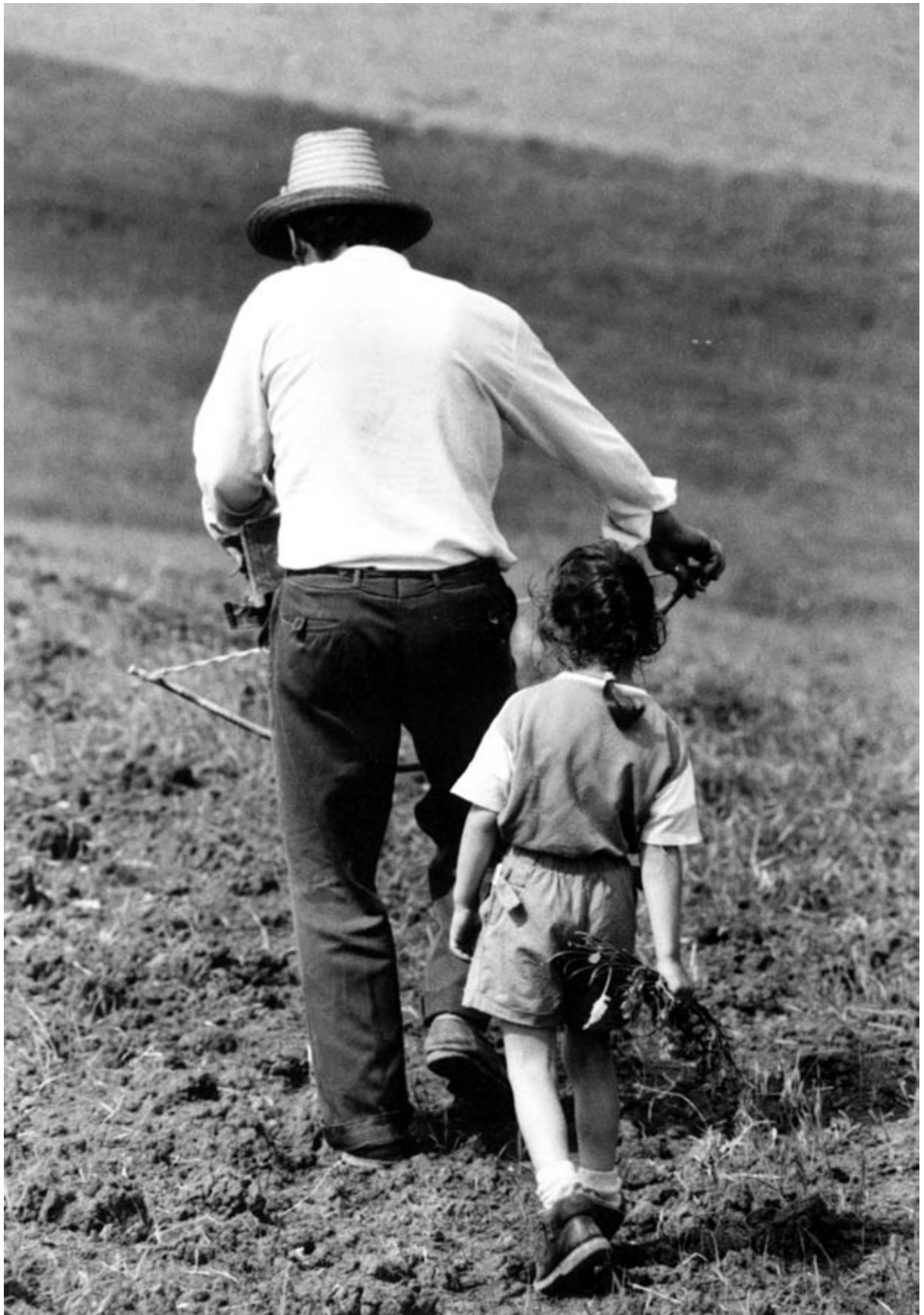
Vetés a domboldalban. Méra, 1996