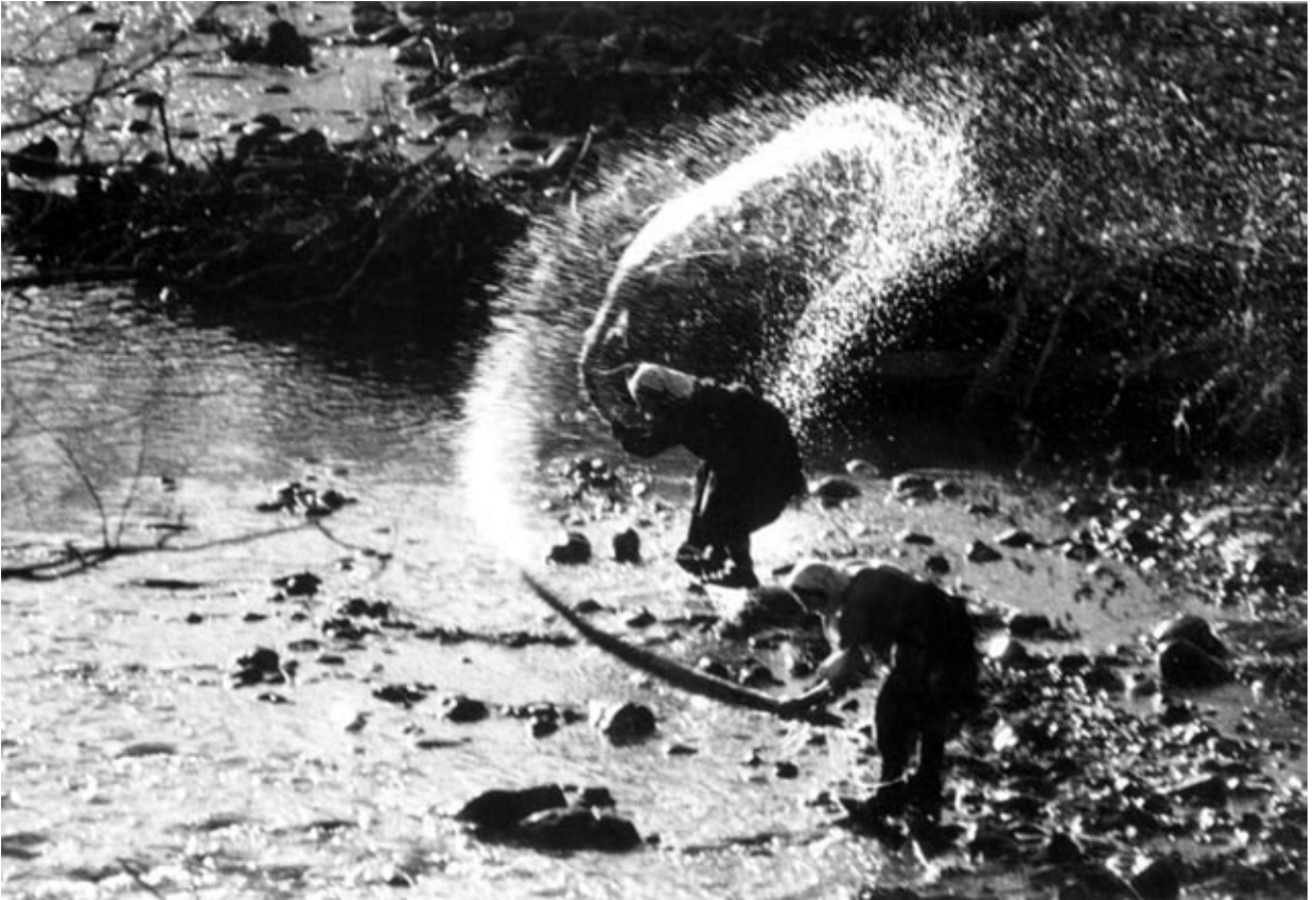
Kendertisztítás. Desze, 1975

hívei szívesen hasonlították össze az erdélyi nemzetek irodalmát és művészetét, azzal a céllal, hogy kimutassák a bennük munkáló történelmi rokonságot, a mélyen ható összefüggéseket.