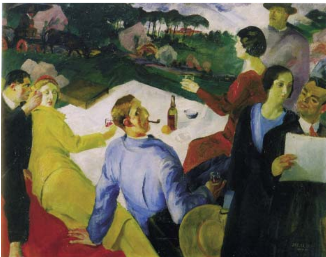
Majális Rómában, 1934