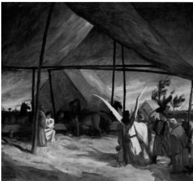
Magyar karácsony, 1932