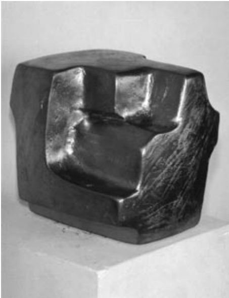
Monolit III, Monolit V