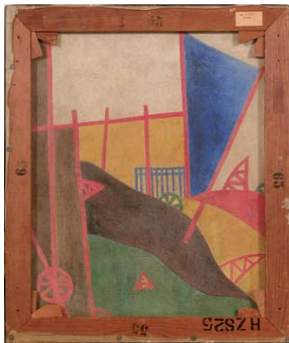
Moholy-Nagy László, Cím nélkül , 1920 vagy 1921 ( Vasútkép szántófölddel és 3-mal ),

– Ehhez egy festmény különleges története is kapcsolódik.