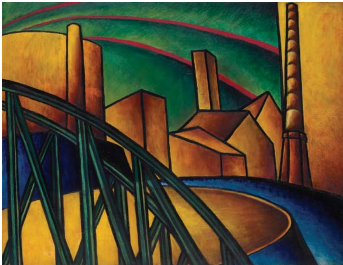
Moholy-Nagy László, Fabrik Landschaft , 1918–1919

Egy ideig európai babonátárgyakat, amuletteket, talizmánokat gyűjtöttem. Volt reneszánsz érem- és plakettgyűjteményem is. Kiváló dugóhúzó-gyűjteményem is volt nagyjából az 1650–1900 közötti két és fél évszázadból, de mikor már egy ideje nem tudtam hozzátenni, csak nagyon drágán, eladtam őket. Talán túlzás nélkül mondhatom, hogy egy másik szenvedélyes korszakomban világhírű, kétezer évet átfogó tűzszerszám- és öngyújtógyűjteményt hoztam össze, amiből megvan még körülbelül ezer válogatott darab, de a javát eladtam, és azok most már egy európai szakmúzeum törzsanyagát képezik.