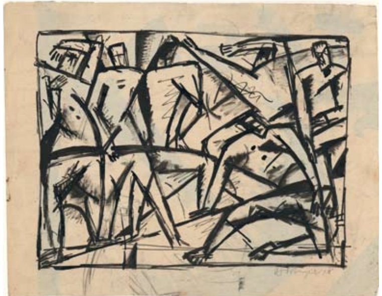
Bortnyik Sándor, Köszöntünk ember a forradalomban (vázlat), 1918

– Eddig zömmel magyar képzőművészetről esett szó. Milyen kiállításokon jelenik meg az iparművészeti gyűjtés?