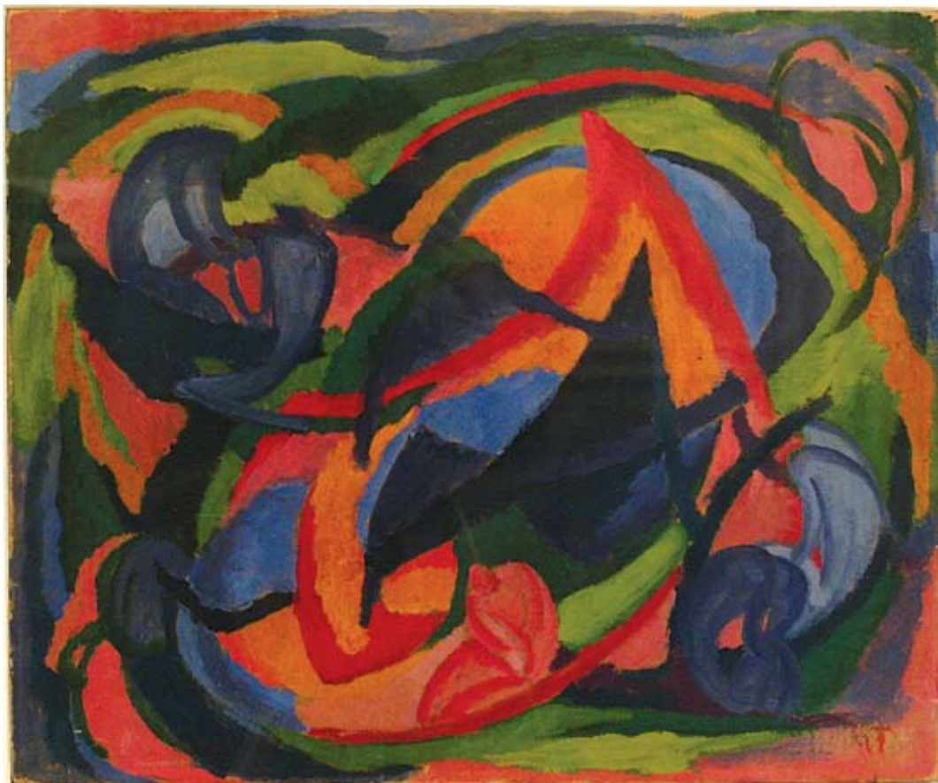
Mattis Teutsch János, Cím nélkül (többalakos jelenet), 1918 körül

– A Magyar Nemzeti Galéria 2006-os Munkácsy Mihály-kiállítása amerikai részének összegyűjtésében döntő szerep hárult rám. Ennek a kutatómunkának többek között két fontos amerikai Munkácsy-mű