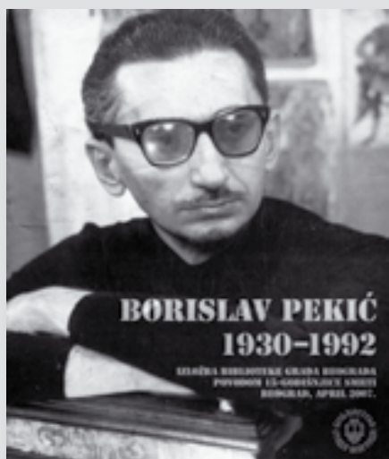
A Belgrádi Városi Könyvtár kiállítási katalógusa

A Belgrádi Városi Könyvtár, a Szerb Fővárosi Önkormányzat és a KeKI kiállítást rendezett az öt éve elhunyt európai hírű szerb író emlékére.