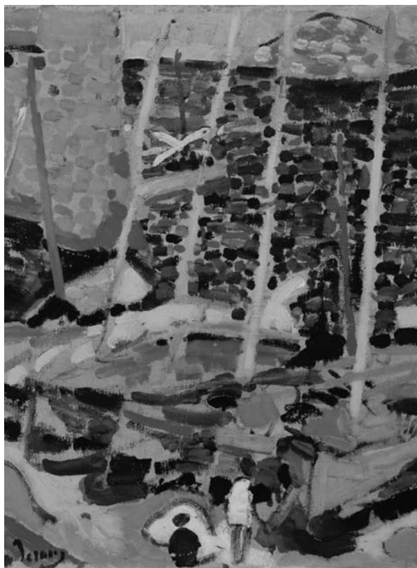
André Derain, Collioure-i kikötő , 1905

Rita és Herbert Batliner nagy volumenű és a XX. század szinte minden jelentős festészeti mozgalomát tartalmazó gyűjteményének Bécsbe helyezésével az Albertina olyan tárgygyűjtesre tett szert, amely eddig hiányzott a bécsi múzeumok palettájáról. Olyan átfogó, festészeti, grafikai és szobrászati gyűjtemény került az osztrák fővárosba, mely az európai művészet nagymestereitől válogat Monet-től Picassóig.