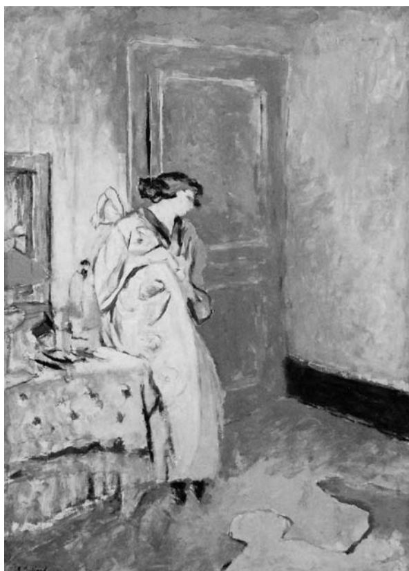
Édouard Vuillard, A kék szoba , 1916–1917

kiadott katalógusban Klaus Albrecht Schröder, az Albertina igazgatója a múzeum metamorfózisaként értékelte az eseményt.