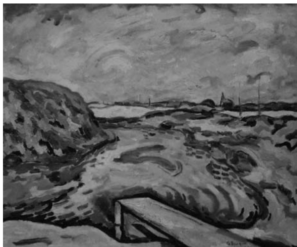
Georges Braque, Antwerpeni öböl , 1906

Mi van e két húzónév között? Az Alfred Sisley, Camille Pissarro, Edgar Degas műveit tartalmazó teremben helyet kapott a kevésbé ismert késő impresszionista Henri Lebasque zöld padon ülő hölgye is, Henri de Toulouse-Lautrec ismert lóversenyképei helyett a Gazelle nevű fehér ló portréja került kiállításra. A nabi mesterek közül az Edouard Vuillard Kék szobájának (1916–17) egyedi színharmóniáját a pointillisták és a Fauve mesterek vad színorgiája követi, olyan főművekkel mint André Derain 1905-ben festett Collioure-i kikötője . Többek közt Lyonel Feininger és Vaszilij Kandinszkij is kiemelkedő művekkel szerepel. Néhány szobrot is bemutattak a rendezők, Constantin Brâncuși és Alberto Giacometti műveit – utóbbi a gyűjtők egyik kedvence volt.