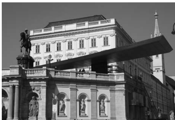
A bécsi Albertina homlokzata

Mindez nem újdonság a rendszeresen Bécsbe látogatók előtt. De a múlt év őszétől látható Batliner-gyűjtemény kiállításával, úgy tűnik, pont került az i-re: az átváltozás beteljesedett. A gyűjteményről