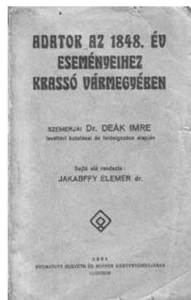
Az 1848. év eseményeinek dokumentumgyűjteménye