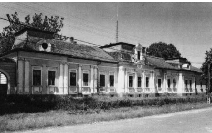
Az 1850-ben épült Jakabffy-kúria Zaguzsénban

Az őszirózsás forradalom kitörése Jakabffy Elemért Lugoson érte. A közrend és a vagyonbiztonság fenntartásában minden támogatást megadott Issekutz Aurélnak, Krassó-Szörény vármegye alispánjának. A nehéz napok eseményeiről részletes naplót vezetett, amely