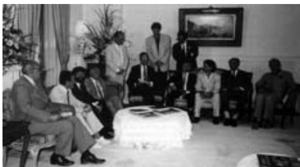
George Bush amerikai elnök találkozik az ellenzék képviselőivel, 1989. július

Méray Tibor gyászbeszéde Nagy Imre sírjánál, részlet, 1989. június 16.