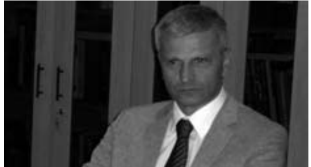
Nebojša Bradić szerb kulturális miniszter

A mai szerb kormány fontosnak érzi, hogy támogassa a nemzeti kisebbségek kultúráját, erősítse az anyanyelven történő tájékoztatás lehetőségeit. Úgy gondoljuk, hogy a közeljövőben életbe lépő rendelkezések, amelyek önrendelkezést adnak a vajdasági Nemzeti Tanácsoknak, segíteni fogja az ottani magyar kisebbség nemzeti identitásának megtartását és fejlesztését. Jobban kellene ismernünk egymás kulturális értékeit, hogy a képek, szobrok, ne maradjanak pusztán múzeumi