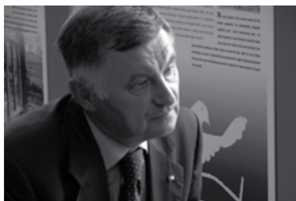
NÉMETH MIKLÓS, Magyarország miniszterelnöke 1988–1990

met, a kancellárt is ott, Varsóban érte utol. Rengeteg ember volt ott akkor körülöttünk, amikor hallottuk a hírt. Sok újságíró. Sokan közülük annyira meghatódtak, hogy elfedték a szemüket, mert könnyeztek. Köztük olyanok is, akik korábban nem éppen a nagy német egység pártfogói voltak. Nagyon boldogok voltunk, hogy így alakultak az események. És még egyszer mondom, hogy ennek a fejlődésnek jelentős részét valóban Magyarországnak, az akkori bátor döntéseknek, az akkori polgárjogi harcosoknak és néhány olyan reformernek köszönhetjük, mint Pozsgay Imre és Németh Miklós.