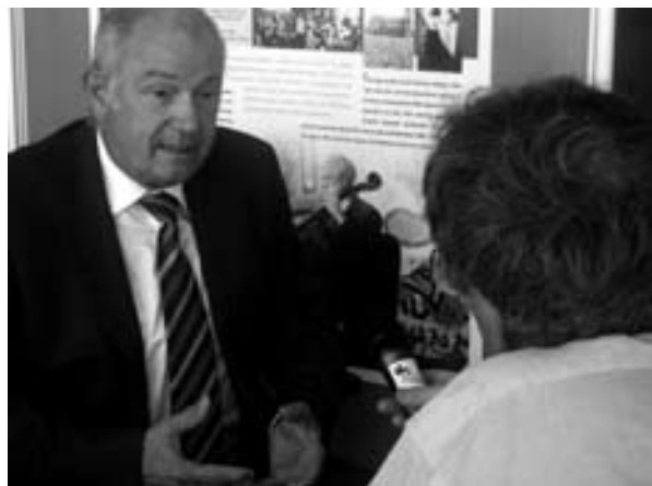
GÜNTHER BECKSTEIN, Bajorország korábbi miniszterelnöke

– Nem sugalltak semmit, és végig abszolút semlegesek maradtak.