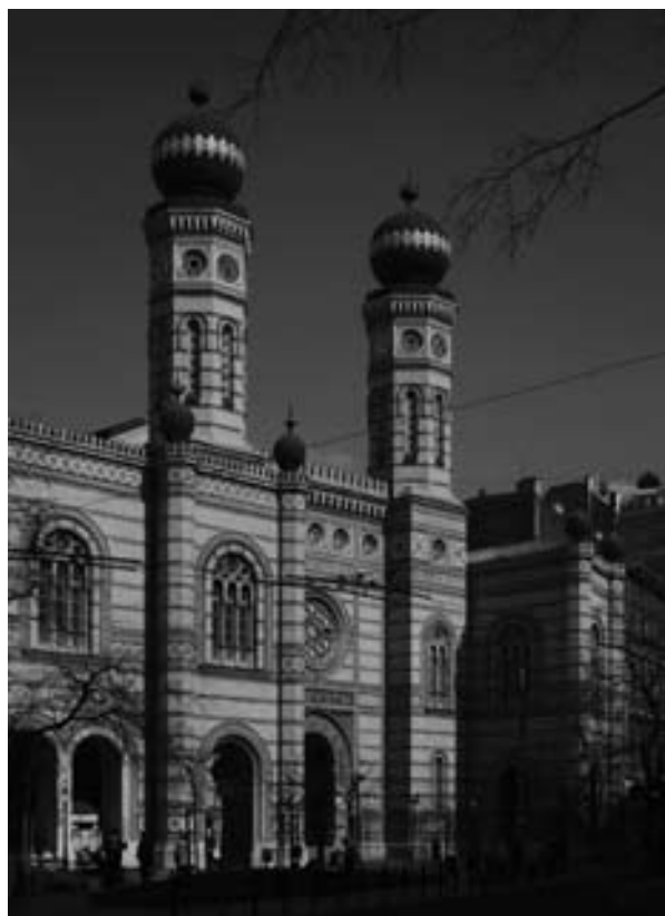
A templom Károly körút felőli nézete

A Ludwig Förster tervei alapján a pesti Magyar Királyi Dohánygyár melletti telken, a mai Dohány utcában megépült zsinagóga, amikor 150 éve felavatták, a világ legnagyobb zsidó imahelye volt – ma a harmadik –, mely a fent említett dilemmák mindegyikét megjeleníti: a tervezése és építése körül zajló hosszas mérlegelés tanúsítja, hogyan vetítették bele az építé-