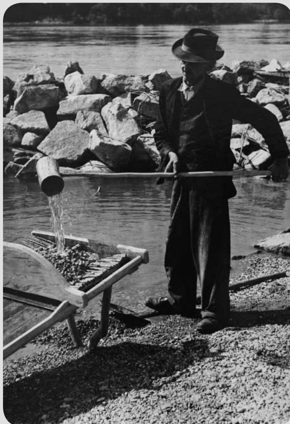
Ismeretlen szerző, Aranymosás