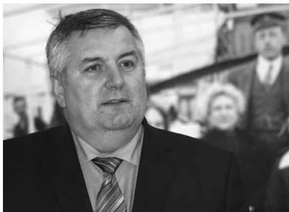
Czukor József , a Duna-bizottság elnöke, a KÜM szakállamtitkára, ma Magyarország berlini nagykövete mond beszédet

Az anyag sok forrásból állt össze, valódi Duna-memti, nemzetközi összefogás eredményeként. A Pozsonyi Nemzeti Múzeum, a Pozsonyi Városi Múzeum, A Kárpáti Németek Múzeuma, a Szlovákiai Magyar Kultúra Múzeuma, az esztergomi Duna Múzeum, a váci Tragor Ignác Múzeum, a szentendrei Ferenczy Múzeum, a Mohácsi Múzeum és a Pécsi Egyetem együttműködé-